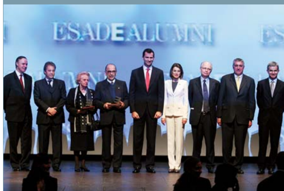
Jornada anual da ESADE Alumni

Todos os participantes do programa, depois de finalizado o mesmo, poderão formar parte da extensa comunidade de antigos alunos do ESADE, mais de 42.000 pessoas que formam uma rede de contatos estendida pelos cinco continentes. Na sua qualidade de antigos alunos poderão se beneficiar dos serviços e atividades que o ESADE Alumni organiza constantemente para manter vivos os vínculos pessoais e profissionais entre todos os seus membros.