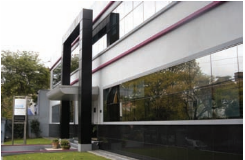
Campus Buenos Aires